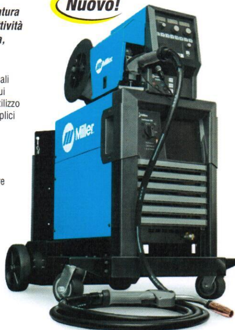
Continuum 500 con alimentatore, torcia MIG Bernard™ Best of the Best (BTB) e carrello/portabombola.

Display e comandi per selezionare programmi, voltaggio, lunghezza dell'arco e velocità di alimentazione filo.